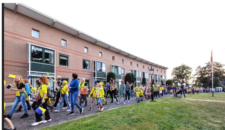
Foto: intocht vorig jaar

De Klompen4daagse wordt georganiseerd onder de vlag van de Sticht Gooise Wandelsport Bond