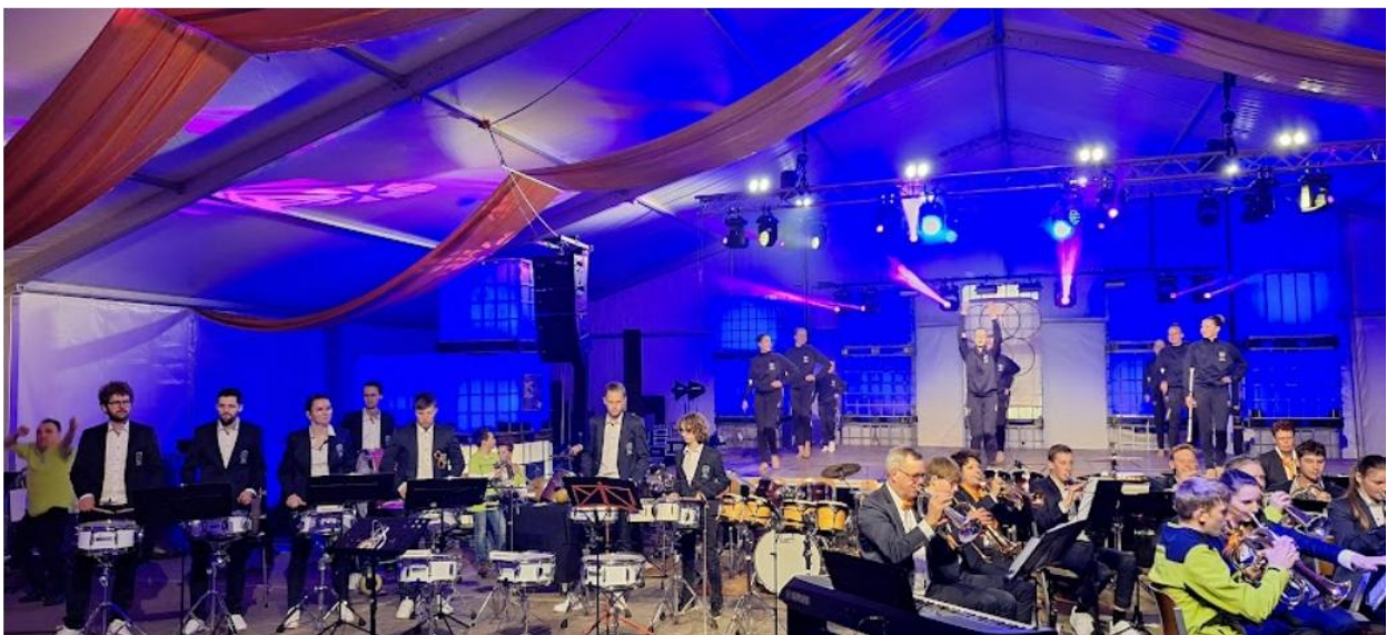
Foto uit “de oude doos”: DWS gaat Olympisch 18-20 april 2024: foto DWS

We zijn altijd op zoek naar helpende handen om onze vereniging te ondersteunen bij onze activiteiten en organisatie. Vind je het leuk en gezellig om ons op 9 mei te helpen met het ophalen van spullen voor de rommelmarkt? Meld je dan aan via www.dwsachterveld.nl/rommelmarkt