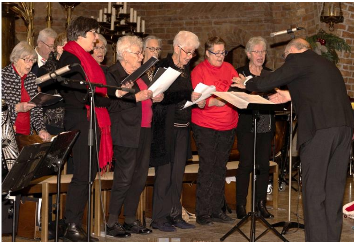
St. Caecilia koor tijdens het Kerstconcert 2025.

Bijzonder hoogtepunt is het uitbrengen van de grammofoonplaat in 1982. Het Sint Caecilia koor zingt daarop o.a. het “Achterveld -lied”. Voor de geïnteresseerden: bij de redactie van Trefpunt zijn nog een paar exemplaren van dit collectorsitem beschikbaar (stuur maar een mailtje...).