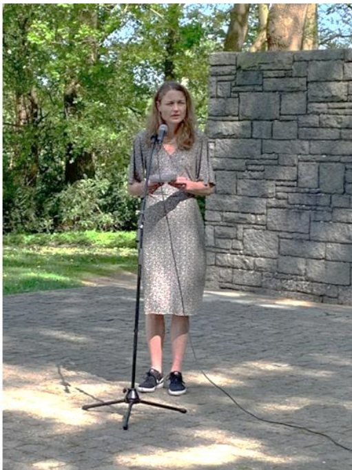
In Neuengamme bij de herdenking

Het weerzien met mijn oma was zeer heuglijk. Negen maanden later ..... werd mijn vader geboren!