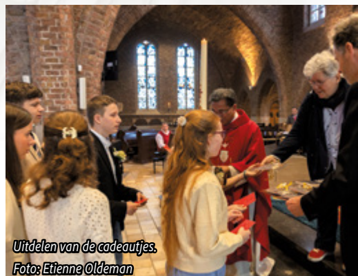
Uitdelen van de cadeautjes.

“Wat een fantastische ervaring om met elkaar mee te maken. Het was prachtig versierd en iedereen liep er geweldig bij. Heel mooi ook dat er verschillende talen en culturen bij betrokken werden. Ik had dit voor geen goud willen missen!” - Sophie