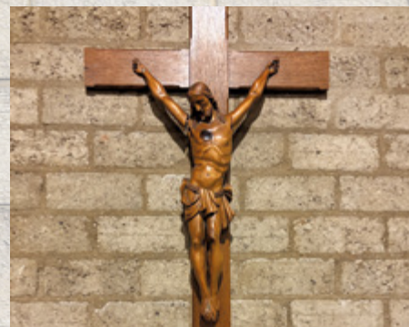
Tegenwoordig hangt tegenover het altaar een kruis met corpus.