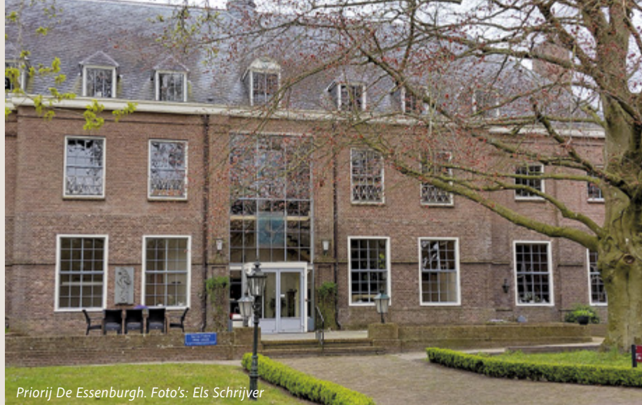
Priorij De Essenburgh.