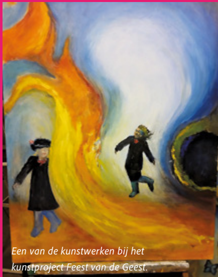
Een van de kunstwerken bij het kunstproject Feest van de Geest.

Van Hemelvaartsdag (14 mei) tot en met Tweede Pinksterdag (25 mei) houden twaalf kerken op de Heuvelrug en in Woudenberg voor de elfde keer het kunstproject Feest van de Geest. In dit kunstproject, waaraan ook de rooms-katholieke geloofsgemeenschappen meedoen, gaat het erom mensen kennis te laten maken met de verbinding tussen kunstwerken, architectuur kerkgebouw en het feest van Pinksteren. Drieëntwintig kunstenaars zullen uiteenlopende kunstwerken tonen in verschillende kerken in Amerongen, Driebergen, Doorn, Leersum, Maarn, Maarsbergen, Zeist en Woudenberg. Het thema van dit jaar is 'Elkaar verstaan'.