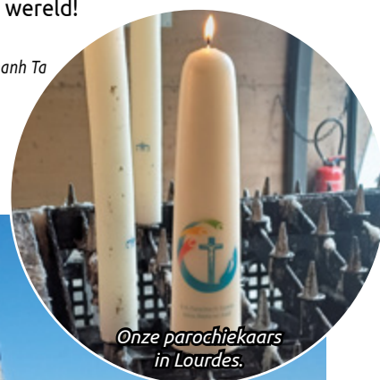
Onze parochiekaars in Lourdes.