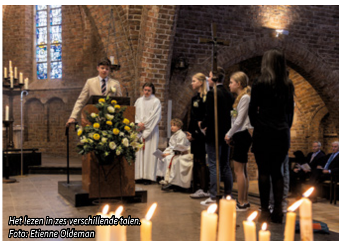
Het lezen in zes verschillende talen.

“Wat een fantastische ervaring om met elkaar mee te maken. Het was prachtig versierd en iedereen liep er geweldig bij. Heel mooi ook dat er verschillende talen en culturen bij betrokken werden. Ik had dit voor geen goud willen missen!” - Sophie