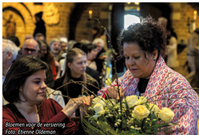
Bloemen voor de versiering.