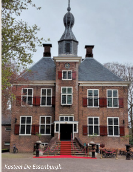
Kasteel De Essenburgh