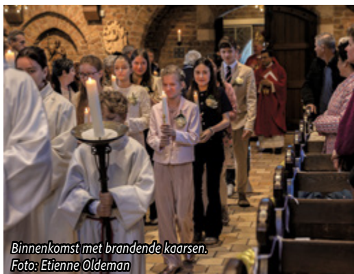
Binnenkomst met brandende kaarsen.

“De viering was heel mooi en feestelijk. Ik vond het leuk om de brandende doopkaarsen mee te nemen in de kerk en neer te zetten voor het altaar. We stonden echt in het middelpunt. Dat was heel bijzonder. Het was wel een beetje spannend om gezalfd te worden door de bisschop. Op het laatst kregen wij ook een cadeautje: een sleutelhanger en een evangelie-boekje.” - Gabriëlla