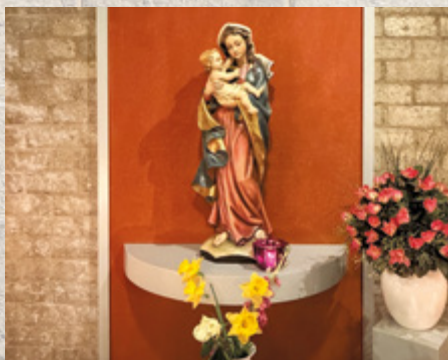
Het huidige Mariabeeld wordt Madonna Germania genoemd.