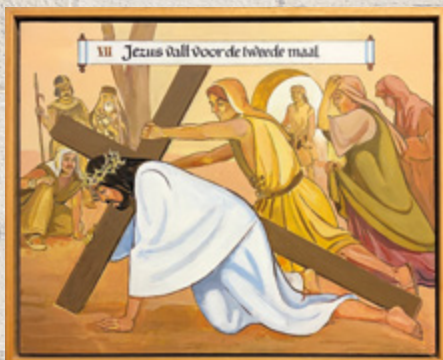
Een schilderij uit de prachtige Kruisweg, geschilderd door parochiaan Wim Middelpaats.