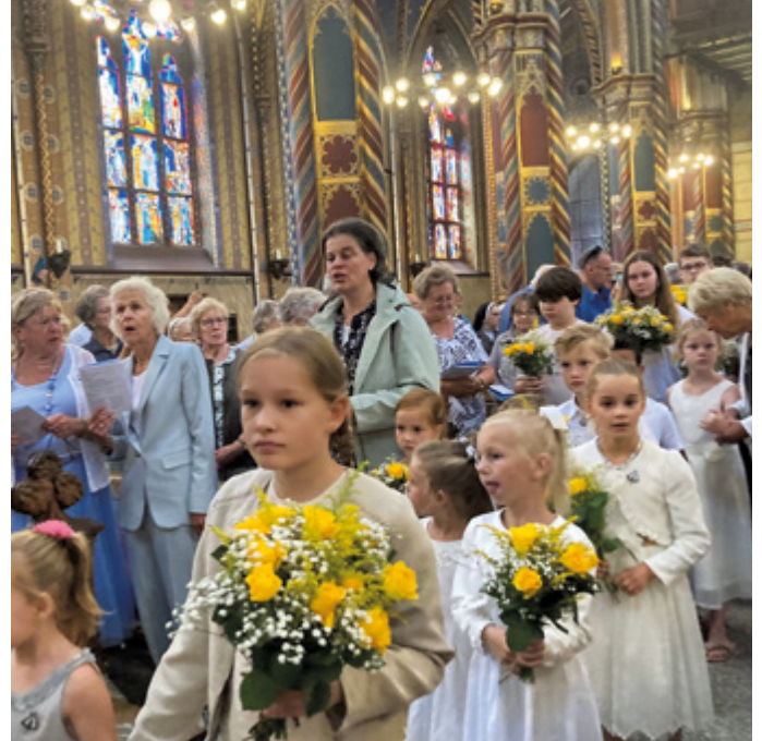
Bedevaart Kevelaar (archieffoto)

Mocht u interesse hebben voor deze dagbedevaart, dan kunt u zich aanmelden bij uw plaatselijke broedermeester (voor de voormalige Lucasparochie) of via het mailadres: achterveldnaarkevelaar@kpnmail.nl