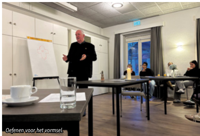
Oefenen voor het vormsel.

zien dat de kinderen het wel interessant vonden! Ik vond het een superleuke ervaring en de kindjes vond ik ook heel lief.” - Daniella