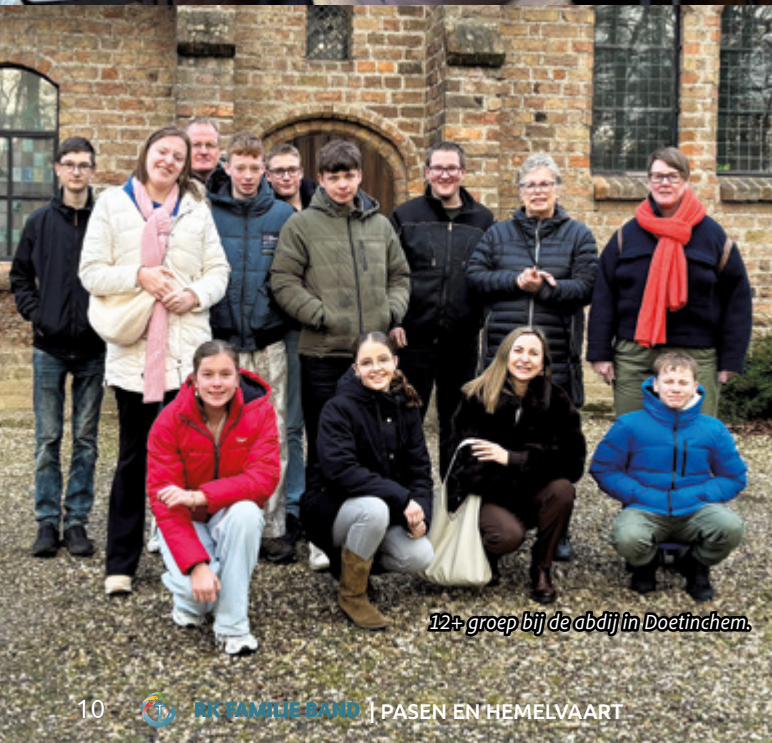
12+ groep bij de abdij in Doetinchem.