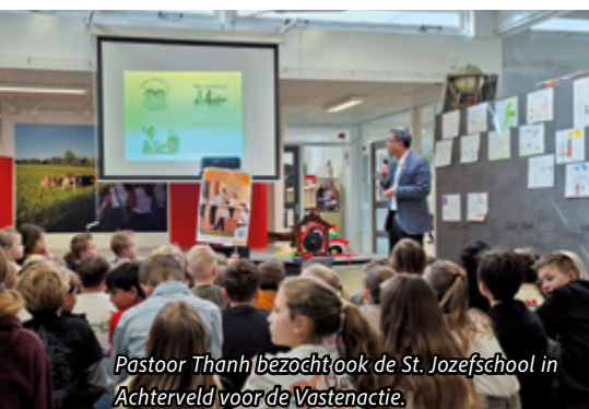
Pastoor Thanh bezoekt ook de St. Jozefschool in Achterveld voor de Vastenactie.

De vermelding van projectnummer '403077' is VOORWAARDE voor de vermeerdering met 50 procent van uw donatie door de Landelijke Vastenactie.