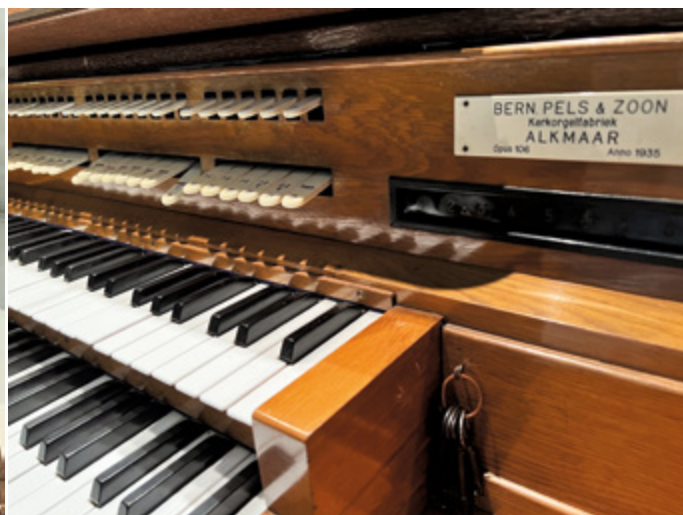
Orgel Sint Jozefkerk Leusden.

uit een orkest, zoals fluit, trompet en hobo.