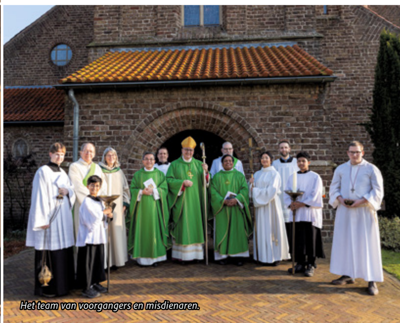
Het team van voorgangers en misdienaren.