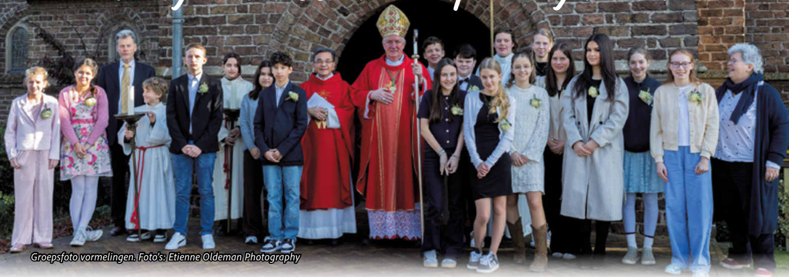
Groepsfoto vormelingen.